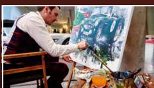
LITERATUR & KUNST LITERATURE & ART