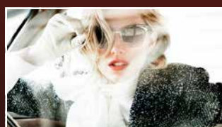
MODE & ACCESSOIRES FASHION & ACCESSORIES