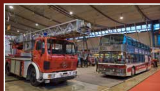
HIST. NUTZFAHRZEUGE & BUSSE HISTORIC TRUCKS, TRACTORS & BUSES