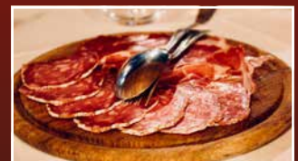
KULINARIK CULINARY ART