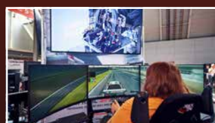
SIMRACING SIM RACING