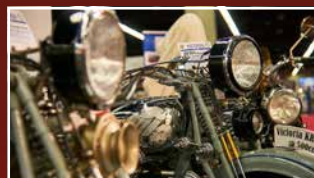
KLASSISCHE ZWEIRÄDER CLASSIC BIKES