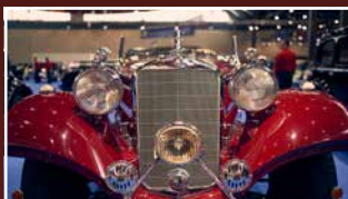
OLDTIMER HISTORIC AND CLASSIC CARS