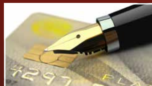
FINANZEN & VERSICHERUNGEN FINANCE & INSURANCE