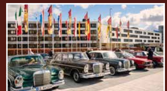
FAHRZEUGVERKAUFSBÖRSE VEHICLE SALES AREA