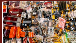
ERSATZTEILE & AUTOMOBILIA SPARE PARTS & AUTOMOBILIA