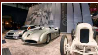
CLUBS & MUSEEN CLUBS & MUSEUMS