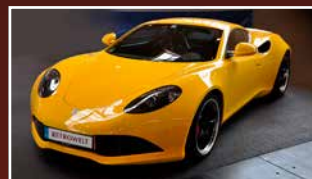
NEO CLASSICS® NEO CLASSICS®