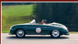
OLDTIMERVERANSTALTUNGEN & REISEN HISTORIC & CLASSIC CAR EVENTS & HOLIDAYS